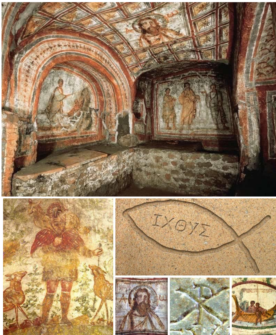
Detalhes das Catacumbas de Domitila e Priscilla, Roma.

Essas pinturas muitas vezes retratavam temas religiosos e símbolos cristãos como o bom pastor, pombas e o pão, refletindo a fé dos primeiros cristãos. Observe: