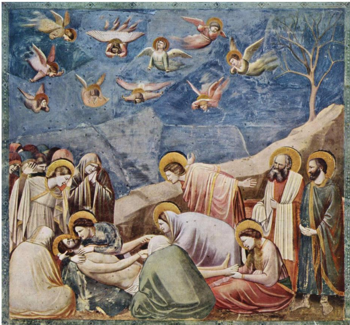
Giotto di Bondone, A Lamentação (c. 1305), afresco, Capela Scrovegni, Pádua, Itália.

Dica: Não escreva em tópicos; em vez disso, organize suas ideias em um texto fluido, com uma introdução, desenvolvimento e conclusão. Dessa forma, você poderá demonstrar uma compreensão mais profunda da obra analisada.